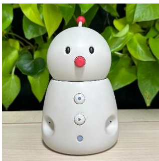
※写真はユカイ工学株式会社が開発しているボッコ (BOCCOemo) です。