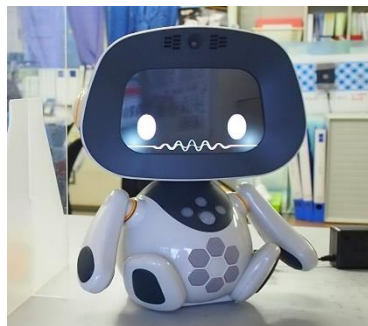
※写真はユニロボット株式会社が開発しているユニボ (unibo) です。

センサーやボタンと連携するロボット BOCCO を使った簡易アンケートを行っております。