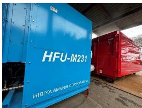
▲HFU と Kantainer®接続の様子