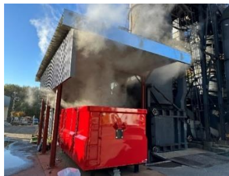
▲木質チップ乾燥の様子